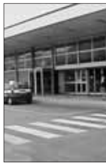
Il "Tito Minniti"